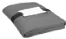
Set polar antipiling (gorro-bufanda-guantes y neceser)